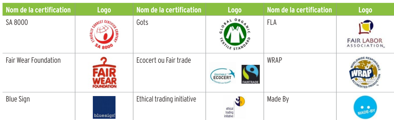
Tableau : Exemples de certifications à rechercher en matière de droits humains et du travail.